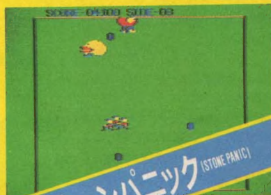
ストーンパニック (STONE PANIC)

PC-6001/mkII、PC-6601対応/僕はド近眼のメガネヒヨコ。だけど他のやつらに石をぶつけ、泣いている間につかまえちゃうぞ。