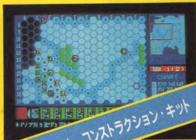
ウォーゲーム・コンストラクション・キット

FM-7対応/自分のオリジナルシミュレーションウォーゲームを作るためのキット。地形、敵・味方の能力等を、好みで決定できる。