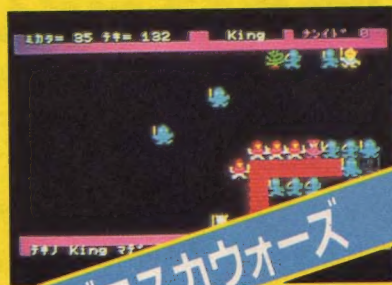
ボコスカウォーズ

X1/C/D対応/中世ヨーロッパを舞台に、王と騎士、歩兵たちが敵の城をめざす。戦いながら騎士も歩兵も成長を遂げていく。