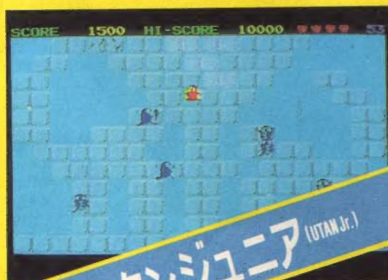
ウータンジュニア (UTAN Jr.)

PC-8801/mkII 対応/ウータン Jr.の行く手を邪魔する宿敵ピラン。積み重ねられた石を落とし、全滅させろ。石のバランスに注意。