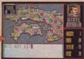
◆同盟関係は大切なものなのだ。

すでに、信長が圧倒的に有利な立場にいるので、信長でプレイする場合は、比較的早いターンで全国統一を成し遂げることができるんじゃないのかな。もちろん信長以外でプレイしても、統一は可能だ。そのときは、とにかく信長包囲網を作るのだ。ほかの大名たちと同盟を結び、徹底的に信長の領土を攻め落としていくといいだろう。