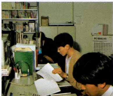
◆ここで単行本の編集作業を行なっている。

とうわけで、光栄からみんなにプレゼント。戦国群雄伝のことなら、コレ1冊ですべてわかってしまうという、「信長の野望・戦国群雄伝ハンドブック」を5人にプレゼントしてしまうのだ。ほしいという人は、下のあて先までドシドシ送ってね。