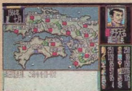
▲さあ、残っているのは長宗我部軍だけだ。あと一息というところだね。

ここではエンディング画面は見せるわけにはいかないんだけど、キミもがんばって全国統一してみてください。これで、誌上再現レポートは終わりにしよう。