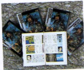
◆信長の野望・戦国群雄伝のオモシロさがギュッとつまった本なのだ。

みんなもよく知っているとおおり、光栄のゲームにはサウンドウェアというバージョンがある。また、単行本も積極的に出しているね。これらは、すべて光栄の社内で作っているものなのだ。他人まかせにしないで、自分たちのゲームに対するイメージをはっきりと打ち出したい！ ということらしい。