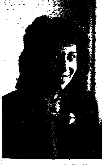
من خلال البرامج والنشاطات المتعددة التي تقدمها هذه المراكز

الاجتماعية التابع للجمعية في مدينة معان. والتقت سموها للجنة النسوية في المركز وطلعت على برامجها وانشطتها للبرحة القليلة ومن ضمنها لحة العدة للتكيف مع الحياة الراهنة. واعربت سموها خلال اللقاء عن تقديرها للتعاون الذي يبديه اللواتيون من مختلف القطاعات واستعدادهم للمساعدة في اي ميدان يحتاجه البراءة. وأكدت على اهمية دور الهيئات الاجتماعية التعاونية في مختلف الظروف وضرورة مواصلة تقديم خدماتها وتكفيها بما يتناسب مع الظروف الحالية. كما اعربت عن تقديرها لجهان الدفاع المدني على الجهود المكثفة التي يبذلها لتدريب اللواتيون على اساليب الوقاية والسلامة العامة. وعبر محافظ معان عن تقديره للخدمات التي يقدمها مركز معان للخدمات الاجتماعية والمراكز الفرعية الاخرى في المحافظة وعدها تسمية مراكز في تأهيل المرأة وتدريبها لتسهم في خدمة مجتمعاتها