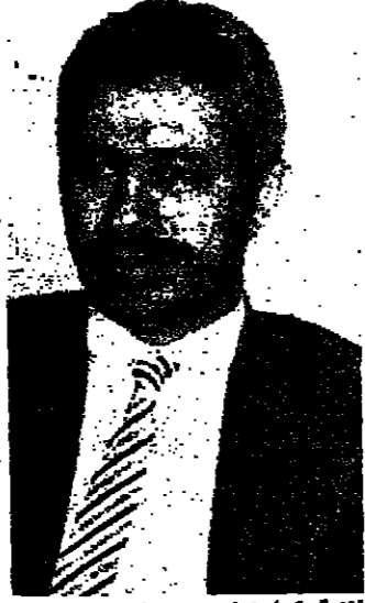
الأمين عام وزارة الشباب

الأردن يفت دائما في تحقيق التفرغ ويخشى تحقيق التفرغ والتمسك بالدم على الصالح لفترة مؤقتة وشباب الأردن خلف قيادة الهاشمية.