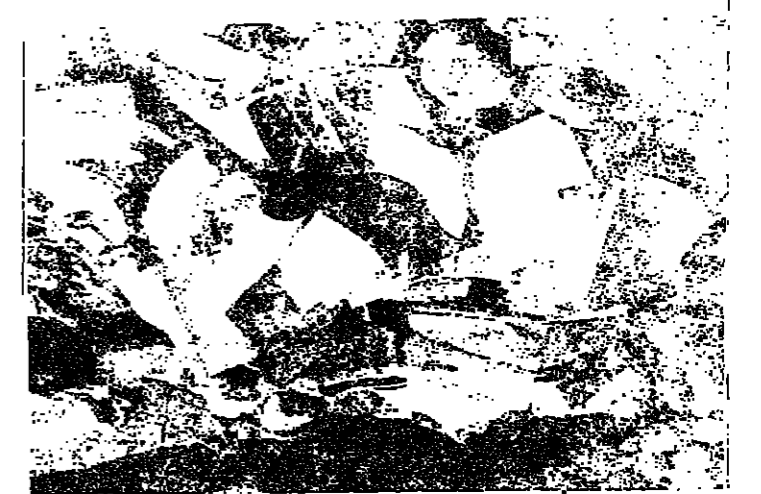
آثار العدوان الاميركي الاطلسي الصهيوني على الاحياء السكنية في المدن والقرى العراقية الصامدة كما وصلت من بغداد...